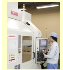
4.金型作成/ジグボ ラ