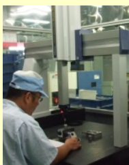
8.初物検査/三次元測 定