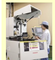
5.金型作成/ワイヤー カット