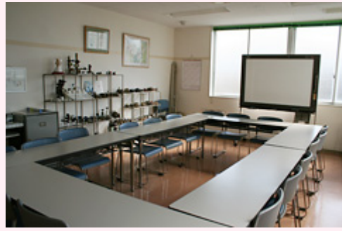
< 会議室 >