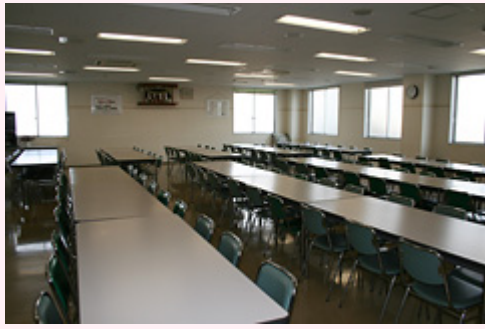
< 食堂 >