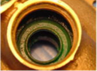
弁座 (材質：青銅鑄物)

UFOTEC減圧弁は、従来問題になったゴムの炭化現象による黒水の発生をフッ素ゴムにすることで解決し、経年的に発生（材料の腐食）する異音及び流量低下の問題をステンレス化（弁座及びOリング摺動部）することで解決しました。