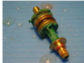
弁棒 (材質：耐食銅合金)